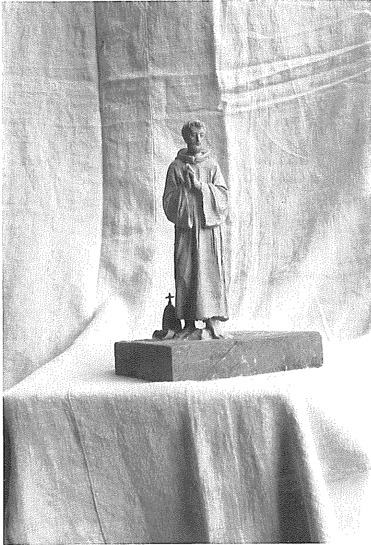
Per un monumento a Celestino V. Bozzetto di Runggaldier Hermann Josef.